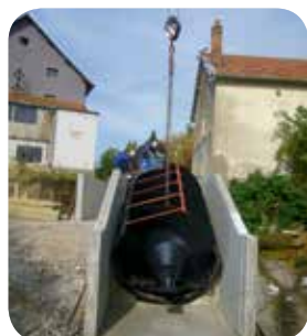
▷ Installation de la vis hydrodynamique (Travaux 2014)

*hors travaux réalisés en auto-construction (mise à sec, démontage de l'ancien vannage, terrassement, construction du local technique de la vis)