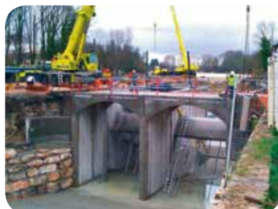
▷ Implantation des deux blocs immergés VLH pour très basse chute (Travaux 2011)

*hors travaux réalisés en auto-construction (rénovation du local technique)