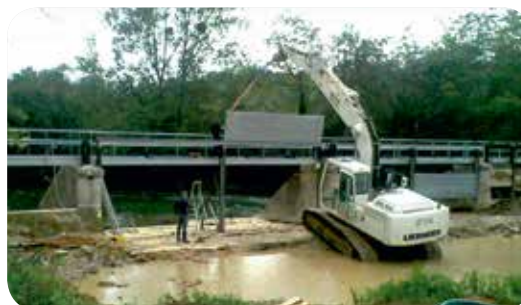
▷ Travaux de rénovation et d'automatisation du vannage (Travaux 2014)