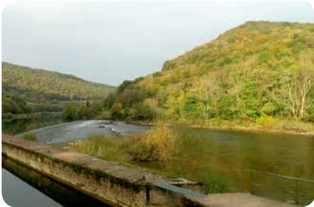
▷ Retenue d'eau d'une centrale - Laissey (25)