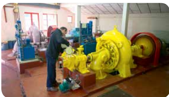
▷ Turbines Francis à l'Abbaye Sainte-Marie de la Pierre-qui-Vire – Saint-Léger-Vauban (89)