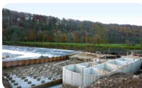
▷ Construction d'une passe à poissons au pied de la retenue d'eau (Travaux 2014)