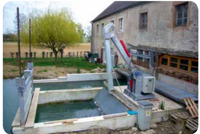
▷ Prise d'eau et dégrilleur automatique - Centrale de Tart-l'Abbaye (21)

On pourra aussi rechercher à adapter les dates d'échéance de remboursement des prêts (trimestrielle, semestrielle ou annuelle) avec les dates de perception des recettes de la vente d'électricité. Une banque peut demander de placer, sur un compte de réserve, une avance de trésorerie équivalente à 6 mois de remboursement de l'emprunt.