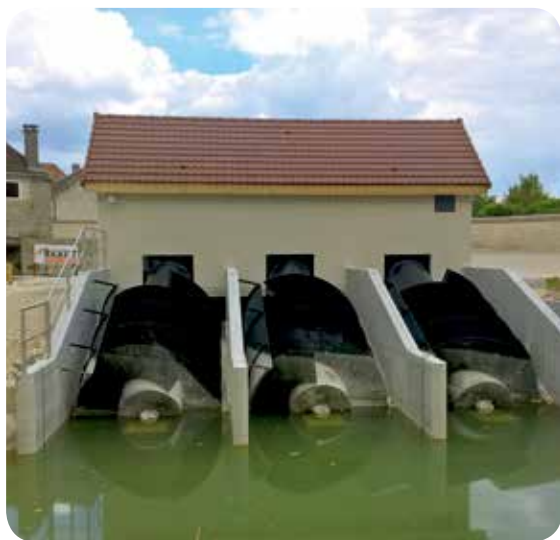
▷ Les vis hydrodynamiques n'entravent pas la circulation descendante des poissons dans la rivière (vis ichtyocompatible)

⊕ EN SAVOIR PLUS : www.moulindecourteron.fr