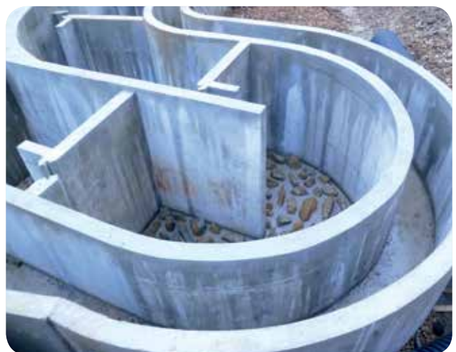
▷ 240 400 € HT investis pour implanter une passe à poissons pour une hauteur de chute nette de 2,1 m - Centrale de Briennon-sur-Armançon (89)

*depuis janvier 2017, l'Onema a intégré l'AFB (Agence Française pour la Biodiversité)