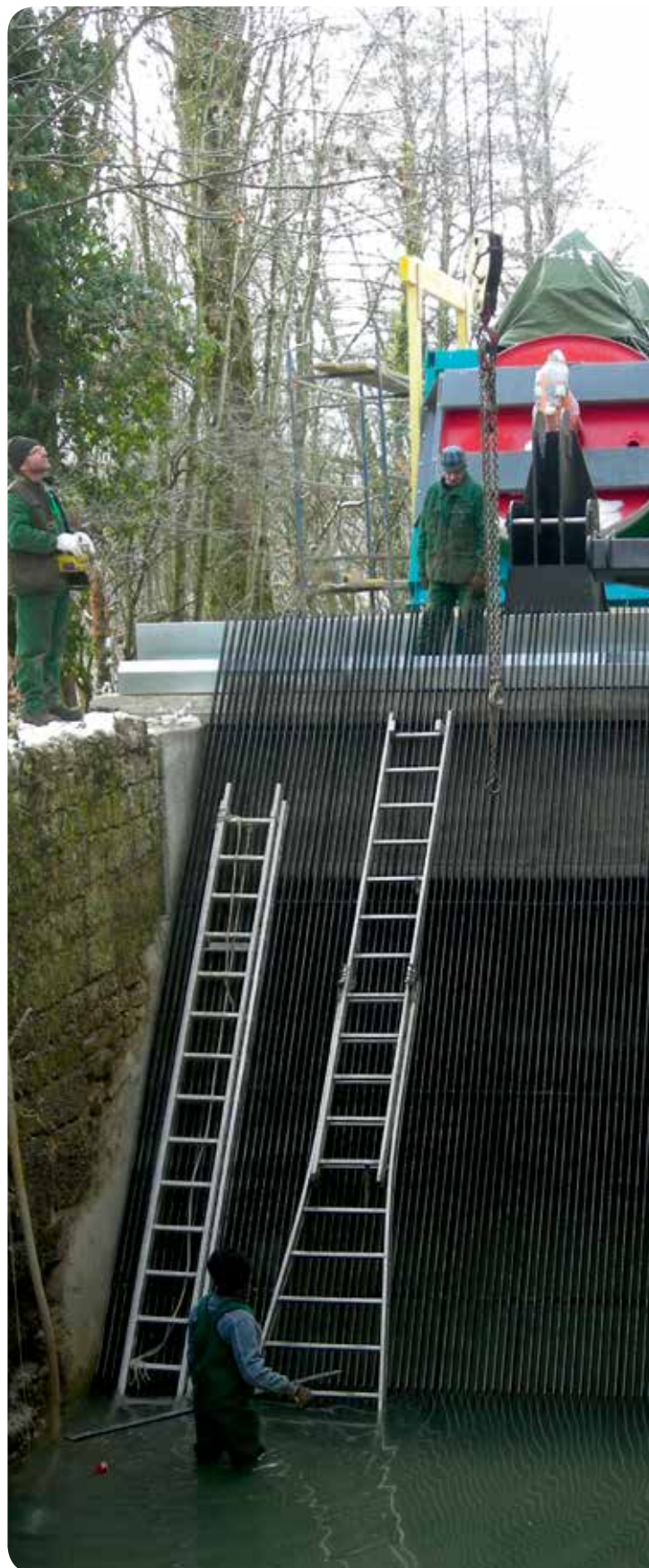
▷ Mise en place de la grille de prise d'eau - Moulin Billerey - Arc-et-Senans (25)

*Le « service de la dette » est constitué du montant du principal (capital emprunté) à rembourser et des intérêts ou du montant des annuités dans le cas d'un crédit-bail.