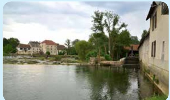
▷ A Arc-et-Senans, plusieurs sites utilisent l'énergie de la Loue pour produire de l'électricité

* Prêt à 3,5 % avec hypothèque sur des appartements dont nous sommes propriétaires.