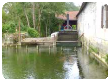
▷ Prise d'eau avec le dégrilleur

*hors travaux réalisés en auto-construction (terrassment, maçonnerie et maîtrise d'œuvre pour environ 80 000 €)