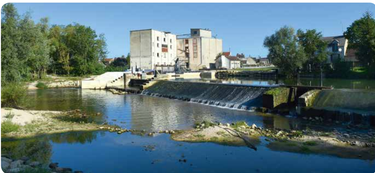
▷ Après travaux d'optimisation, la centrale du moulin de la Tête Noire a amélioré sa production de 50 % - Briennon-sur-Armançon (89)

⊕ EN SAVOIR PLUS : https://www.cre.fr/Electricite/Reseaux-d-electricite/Tarifs-d-acces