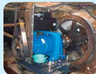
▷ Modernisation de la production d'énergie du moulin avec multiplicateur de vitesse et génératrice de courant