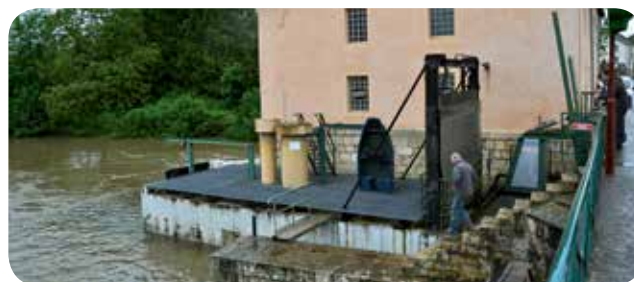
▷ Groupe immergé - Centrale de Scey-sur-Saône (70)