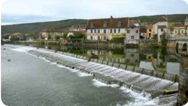
▷ Barrage sur la Loue - Quingey (25)