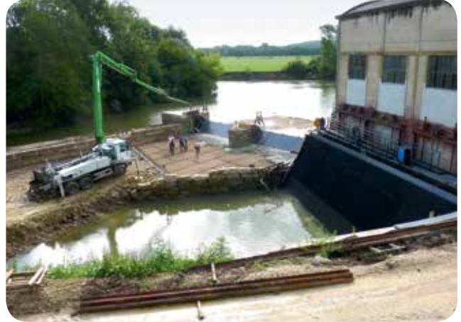
▷ Chantier 2014 : 838 000 € HT investis pour réhabiliter une usine hydroélectrique à l'abandon depuis 30 ans - Centrale de Ray-sur-Saône (70)

Ces chiffres n'ont que la valeur d'une moyenne car il est coutume de dire qu'en petite hydroélectricité, chaque cas est particulier, lié à l'état du site et aux améliorations techniques, environnementales ou réglementaires à effectuer. C'est d'autant plus vrai entre les secteurs Bourgogne et Franche-Comté aux reliefs et débits de cours d'eau très différents.