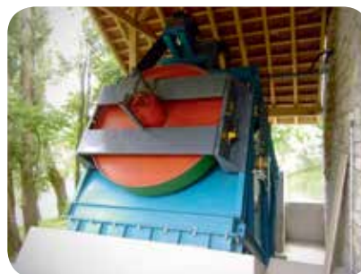
▷ Tête de la turbine Kaplan inclinée en siphon