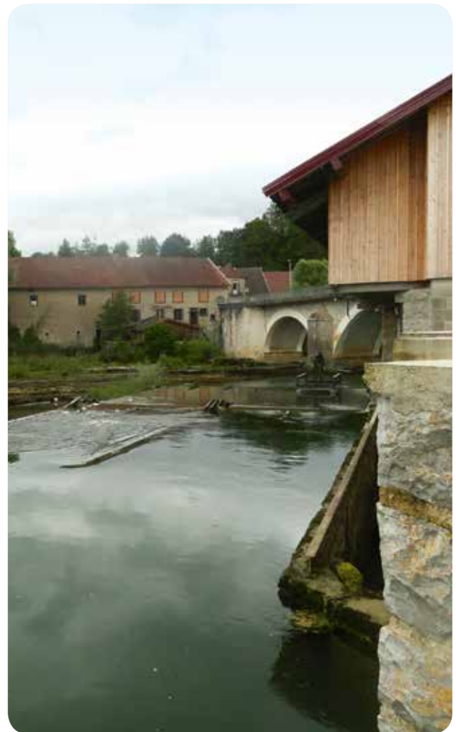
▷ Centrale Jotelec - Pont-de-Poitte (39)

Même si la réglementation fiscale évolue régulièrement, l'incidence de cet impôt peut être conséquente sur les résultats annuels. Aussi, la réflexion amont sur le choix du statut juridique du producteur et les seuils d'imposition est fondamentale.