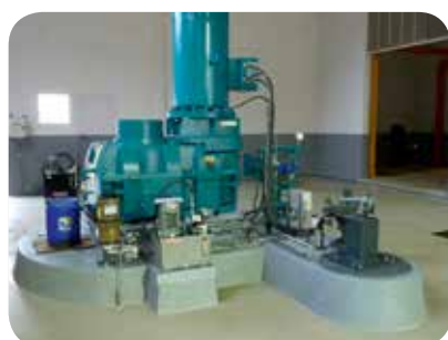
▷ Multiplicateur de vitesse et génératrice de courant

*hors frais d'acquisition du site (ratio de 3 785 € HT/kW avec achat du site à 600 000 €) / hors travaux réalisés en auto-construction