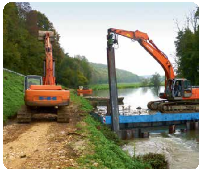
▷ Intervention sur barge pour création d'un batardeau en palplanches - Travaux 2014 - Centrale de Ray-sur-Saône (70)