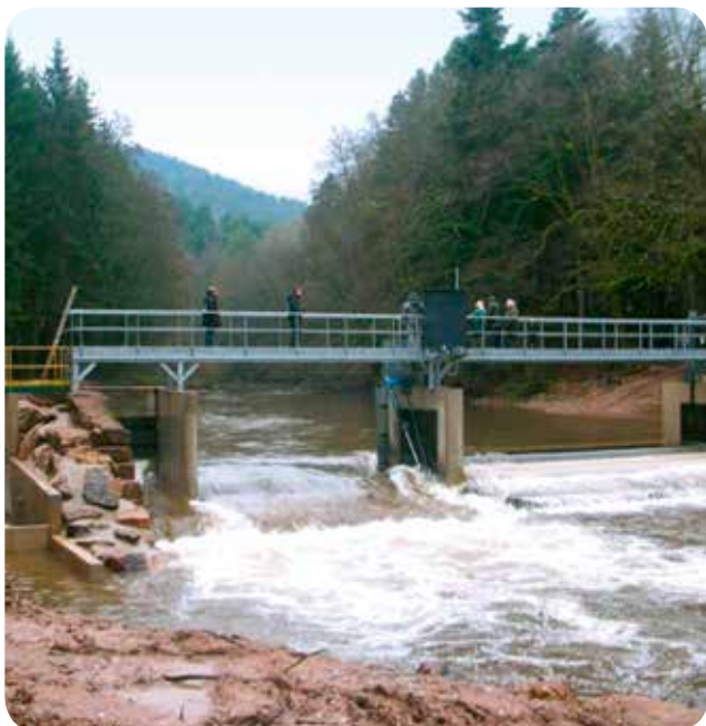
▷ Centrale de Raon-l'Étape (88) rénovée suite à son acquisition par Ercisol