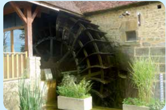
▷ Roue à aubes de type Zuppinger entièrement fabriquée par les membres de l'association

Zuppinger de 30 kW fabriquée et mise en place par nos soins. Elle a tourné pour la première fois en août 2011. Nous y avons adjoint une installation novatrice pour suivre le fonctionnement et la production par commande numérique. L'association de l'électronique avec la génératrice a montré des incompatibilités obligeant à revoir la cinématique de l'installation avec, notamment, plusieurs changements de matériels entraînant de longs arrêts. Heureusement, nous avons contracté une assurance « Responsabilité civile - Bris de machine - Perte de recette » pour une quittance de 2 050 €/an (en 2015). Ceci a largement compensé les pertes de production des premières années et cette assurance nous permet de recevoir du public sans appréhension.