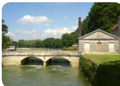
▷ Ensemble avec le local technique