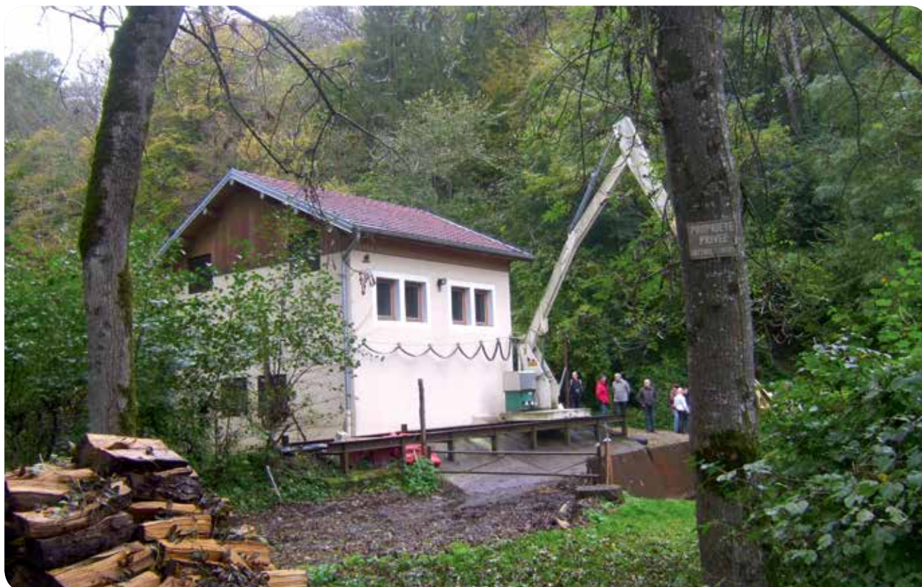
▷ Centrale sur l'Ognon - Montagney-Servigney (25)

Les propriétaires de transformateur électrique de puissance supérieure à 50 kV de tension amont sont assujettis à l'IFER avec un mode de calcul différent. En 2019, par exemple, cet impôt est fixé à 14 624 € par transformateur de puissance supérieure à 50 kV et inférieure ou égale à 130 kV, 50 916 € entre 130 kV et 350 kV, et de 150 036 € au-delà de 350 kV (cf. article 1519-G du Code général des impôts).