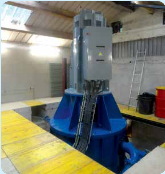
▷ Génératrice avec turbine Pelton sous conduite forcée et 126 m de dénivelé - Centrale du Gour - Laissey (25)

Exploitant plusieurs centrales en France, je m'aperçois que le coût des assurances (responsabilité civile, bris de machines et pertes d'exploitation) est important et peut atteindre annuellement 10 % des recettes d'une centrale. Bien qu'ayant de bons rapports avec mon agent d'assurance, après calcul des primes payées sur 10 ans d'exploitation et peu de sinistres, je vois que je suis largement déficitaire sur ce poste. Je me pose la question de m'auto-assurer sur certains postes, c'est-à-dire de renégocier les termes et les primes de mes contrats à la baisse et de provisionner ces sommes pour couvrir moi-même les pannes ou bris de matériel, voire les pertes d'exploitation. C'est tentant mais pour l'instant, je ne m'y risque pas !